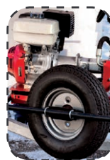
Roue de secours (option)