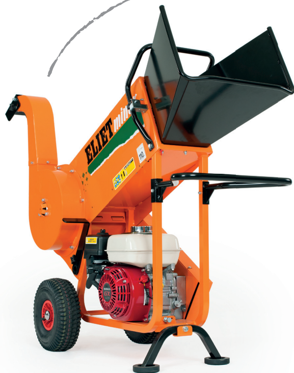
ELIET MINOR 4S