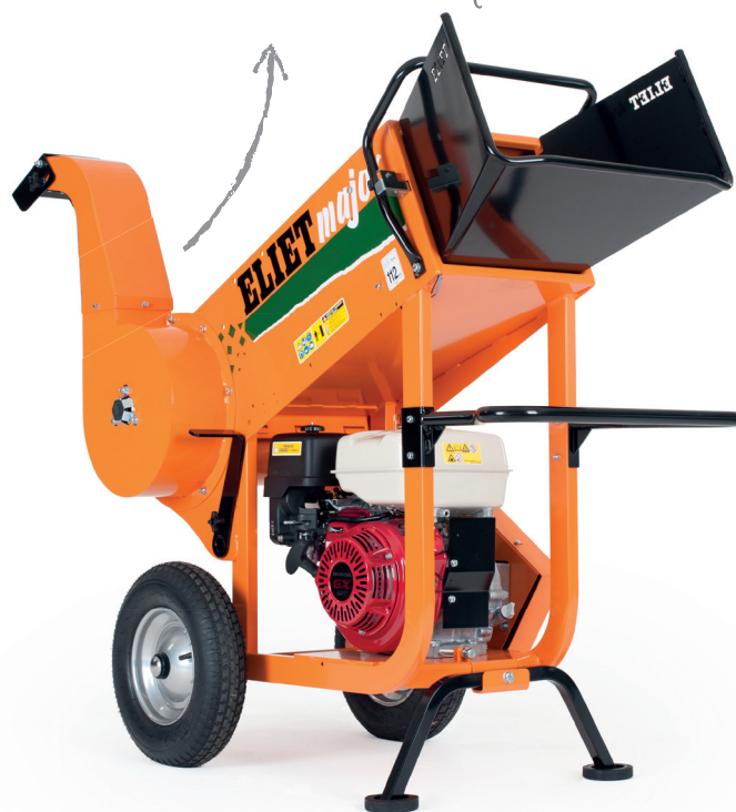
ELIET MAJOR 4S