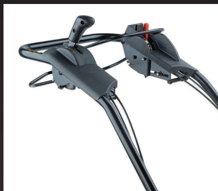
3 vitesses AV/1 vitesse AR